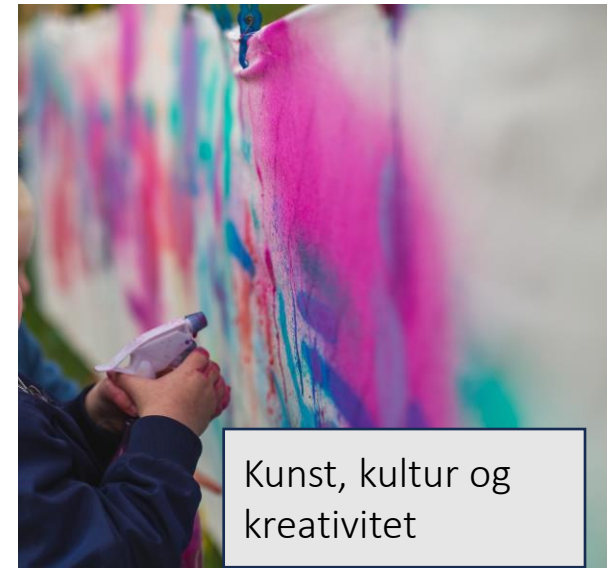
Kunst, kultur og kreativitet