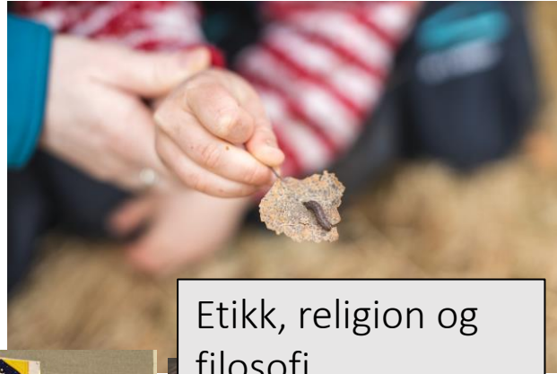
Etikk, religion og filosofi

Barnehagen skal sjå fagområda i samanheng og dei skal vere gjennomgåande i alt innhald i barnehagen. Fagområda blir fletta inn i leiken og barna skal utvikle kunnskapar og ferdigheitar innanfor alle fagområda gjennom undring, utforsking og skapande aktivitetar. I arbeidet med fagområda brukar me ulikt materiell og utstyr, teknologi og digitale verktøy, spel, bøker og musikk. Fagområda i barnehagen er likt med dei faga barna seinare møter i skulen.